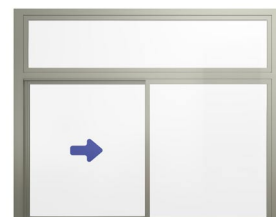
XO med överljuss