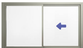
OX (O=Fast glas, X=Rörligt glas)